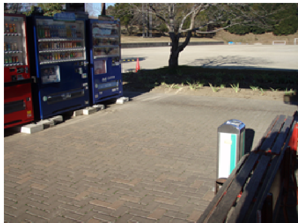
自動販売機前休憩所，トイレ入り口に吸殻入れ設置