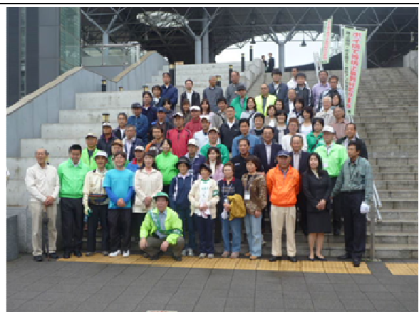
駅前クリーン活動