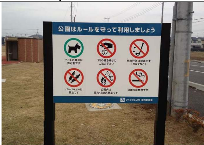
みらい平どんぐり公園