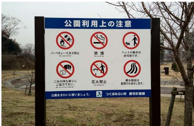
福岡堰さくら公園